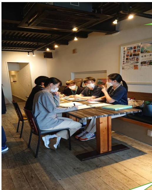
学生がディスカッション中